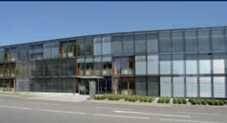
Internationales Bankhaus Bodensee AG in Friedrichshafen